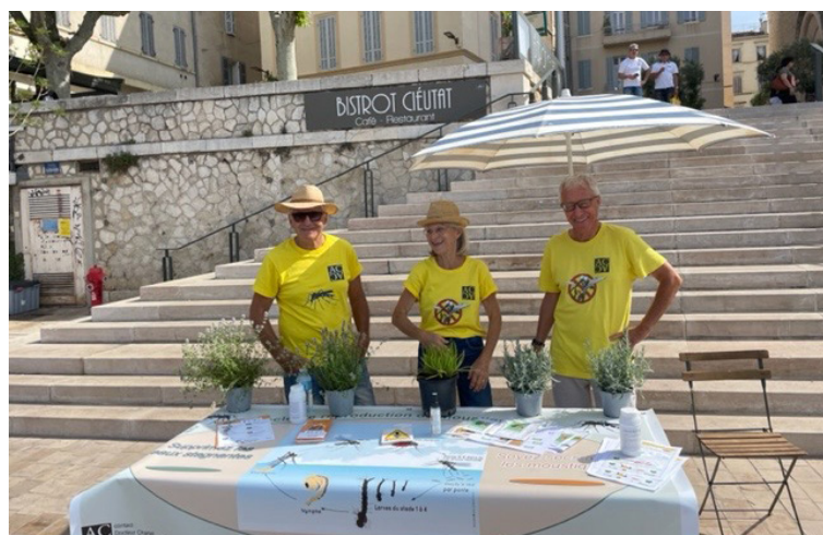
Drôles de moustiques sur le marché - dimanche 7 juin 2022

La Ciotat Proximité - tél : 0 800 013 600