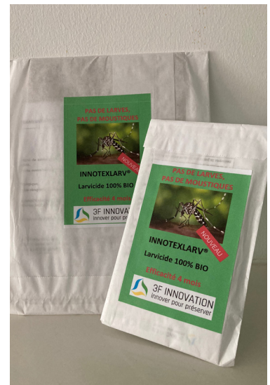
Plusieurs formats disponibles

Ce produit est une alternative aux formes en granulé type Granobac (disponible à la jardinerie du Moulin).